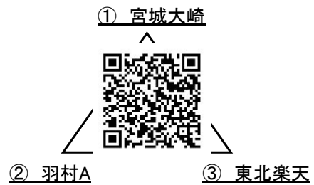
Fブロック(新江合川G)